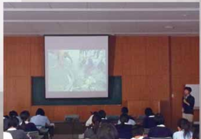
南スーダン講演会／百合学院高等学校

このように、今回の総合学習・百合学院高等学校の国際理解は、知らないことを知る努力、そして、知ることには責任が伴い、何が出来るかは今すぐにはわからないが、あきらめず解決方法を追求するという結論に導かれました。彼女達の感性は豊かで繊細です。この多様な思いを、私一人が受け取るのではなく、国連の同僚を通じて、南スーダンに届けることを試んでいます。南スーダンの人びとは、彼女たちのメッセージ（国際理解）にきくと答えてくるでしょう。その時、百合学院高等学校の「国際理解」は更に深まると思います。その国際理解は、さらに行動に移すことのできる「人」へ、そして平和な未来に向けて、持続することへの希望です。