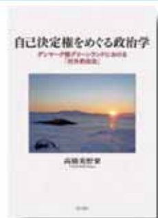
A5判 392頁 ISBNコード：9784750339405