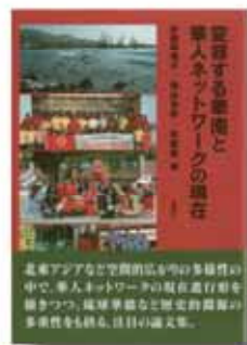
A5判 414頁 ISBNコード：9784831874412

先ず本企画は、社会学・経済学・人類学・歴史学・移民研究など多様な専門領域からなるグローバルな視野からの華南研究であり、分野横断性のもつ多様性・多層性を具体化した成果といえる。さらに、香港・マカオ・広東・福建・広西・海南などのいわゆる華南地域に限らず、サハリンはじめ、北東アジア・東南アジア・沖縄・欧米を含めたグローバルに広がる双方向性をもった華人ネットワークの多様性を、国家や地域を超えた地域横断性の視点から多面的に解明した点で、独創性と波及性が高く評価できる。とりわけ、北東アジアを舞台にした華人ネットワークに関する議論では、これまでほとんど知られていなかった事実が明らかにされており貴重な成果の一つといえよう。とともに、現代華南の、とくに香港を含む地域政治社会の構造的変動分析とその研究成果のアクチュアリティにも注目すべきであろう。もちろん、個別的内容については、今後さらに分野/地域横断性をめぐる内外の研究者間の相互架橋による、より高次の華南研究の総合化と、多言語による発信が期待される。こうした総合的かつミクロな事例研究を含む本企画「国際華南研究」は、企画推進過程で具体化した人的ネットワーク(厦門大学・中山大学・香港大学・香港城市大学・マカオ大学など)形成とその蓄積がなければ実現しえなかったと考えられる。その基盤の上に研究代表者を含む呼びかけで、2011年「日本華南学会」が創設されたことは、華南研究が新たな段階に入ったことを意味することになるだろう。これらの点に鑑みて、本企画は、地域研究コンソーシアム・研究企画賞に値するものと評価される。