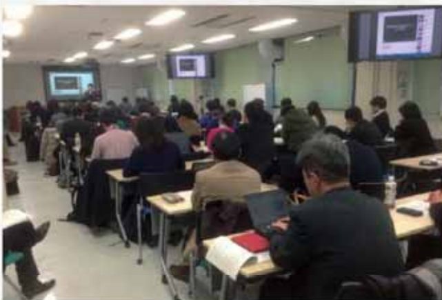
移民政策学会2014年度冬季大会会場風景

生後2カ月でブラジルから来日した私は、家族の中で唯一、ポルトガル語を話すことも理解することもできない。そんな私が「映像」に出会ったのは小学6年生の頃だった。それまで、自分の想いや葛藤を家族にも友人にも話すことのできなかつた私にとって、映像は自身の心の中をさらけ出せるツールのひとつである。これまで制作した作品を振り返るとどれも打ち明けられなかった想いを綴ったものだった。家族に向けて、友人に向けて綴っただけの映像だったはずが、多くの方から感想を頂き、改めて感じたこ