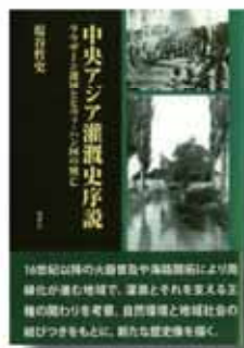
A5判 304頁 ISBNコード：9784894891975