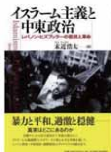
A5判 480頁 ISBNコード：9784815807504

本書では、ヒズブッラーを、レバノンという国民国家に誕生した組織でありながら、独自の「外交」を展開しうる自律的かつトランスナショナルな性格を持ち、国民国家を超克しようとするアクターと定義づけたうえで、この組織を中心に据えた時に見えてくる、中東をめぐる国際政治の