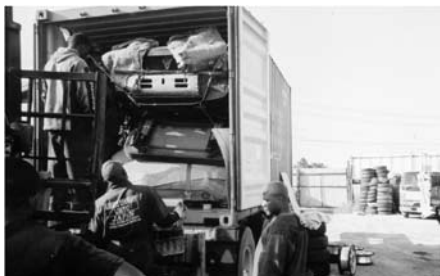
写真1 日本のヤードでコンテナに積み込んでいるところ

この搬出用のコンテナには、二種類ある。ひとつは二〇フィート・コンテナで二〇トン積める（写真1参照）。もうひとつは四〇フィート・コンテナで三〇トン積める。車は利益が大きいが、スペースをとる。したがって、日本で車を安く買い、カメルーンで高く売る、というのは当