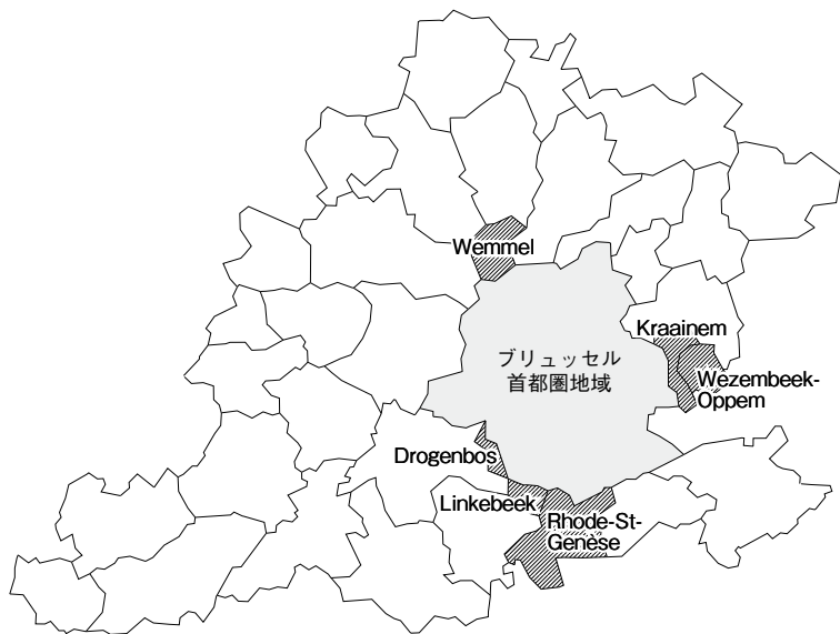
図2 ブリュッセル周辺の言語特別措置地区（斜線部分）

化し、その結果、同決議案の本会議での一括採決は不可能となり、三月三日同決議案は、①連邦制における、補完性の原則や欧州統合との整合性、二大共同体からなる連邦制などを確認した「一般原則と目的」、②「財政の自律性」、③「ブリュッセル問題」、④「権限の委譲」、⑤「その他の懸念事項」の五つに分けて採決が行われ、それぞれが可決された。これらの決議は結果として、連邦制の制度面、権限の配分、財政基盤に関して現行の体制の大きな変更を目指すものであった。とくに制度では、二つの連邦構成「国家」(États fédérés フランデレンとワロンフランス語圏)と、付与される権限がより限定的な二つの連邦構成「領土」(territoires fédérés ブリュッセル首都圏地域とドイツ語共同体)の設立が目指されていた (Pagano 2000: 7)。 このように、フランデレン憲法試案が目指した諸主張の一部は、フランデレン議会における決議として実質的なものとなったが、それは一九九九年以降、連邦レベルの論議へとつながっていく。