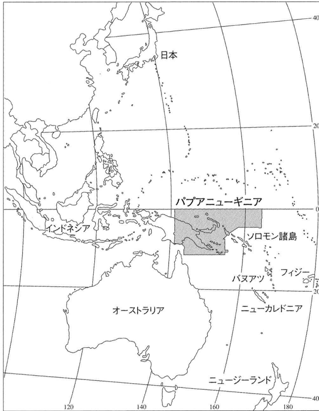
パプアニューギニアの地政学的位置 と私のフィールド