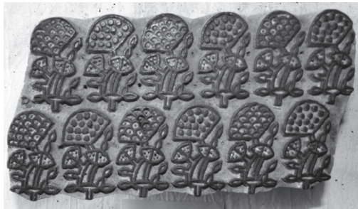
写真4 ジマルディ文様の木版（ダマルカー村、1988年。イスマーイール製作）

デザイナーは、新しいデザインを作り出すために、ダマルカー村更紗の伝統的な文様を源泉とした。伝統的なデザ