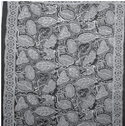
写真5 スラウエシ渡り更紗の復刻

によると、一三四〇年プラス・マイナス四〇年に製作されたとされる。同じ模様の更紗が、エジプトのフスタート遺跡からも出土している。