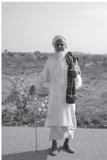
写真2 アジュラクを着用する男性（カッチ県、2008年）

カトリーが生産に従事する染織品のなかでは、絞り染めの布が、婚礼衣装など晴れ着として使用されることが多いのに比べて、更紗は、普段の生活のなかで使われることが多いものであった。カッチ地方で生産されていた更紗製品には、女性のスカートや被り布、男性用の頭に巻く布として用いられているルマールやガドロ（ベッドシート）、アジュラクと呼ばれる両面染めの布などがある。アジュラクは、カッチ北部バンニ地方からサインドにかけて、牧民の男性が腰に巻いたり、肩掛けにしたりして用いる（写真2）。アジュラクは、模様がずれないように布の両面から捺染したもので、色は洗うほど輝きを増し、また身体にまとうと身体を冷やすため酷暑のなかで好まれたという。カッチ地方で現在最大の更紗の産地となっているのは、