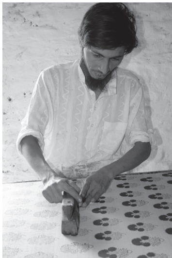
写真1 木版を捺して媒染料を布に付着させる工程（2008年）

木型は、サーグ（学名 Tectona grandis ）という木を素材にして、ノミや手動ドリルを用いて彫刻される。カッチ語で更紗技法のことをチャーペル、更紗生産に用いる木版のことをパルあるいはポールと呼ぶ。現在では、カッチ語での呼称に加えて、英語で更紗技法のことをブロック・プリント（木版捺染）、木版のことをブロックと呼ぶことが多い。ひとつの木版は、およそ二千メートルの捺染に耐える。それを超えると、木版の模様部分が欠けたりして使用できなくなるため、新たに木版を作り直すことになる。したがって、更紗を生産する工房には、使えなくなった木版が大量に保存されていることが多い。筆者は、更紗製品のデザインや技法の変化について明らかにするために、このような保存されている使用済みの木版の調査を行った。