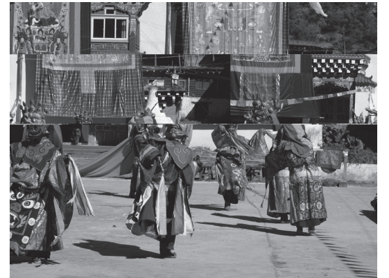
写真1 東チベットの僧院で復興されたチャム（2006年）

二〇〇六年に参与観察したアムド地方の同仁でのルロ祭りでは、外国人観光客から入場料をとるなど、祭りの観光資源化が図られていたし、新龍県のある僧院では、僧院の祭りとしてツェチュ祭が復興され、チャム（仮面舞踏）が実施され（写真1）、徳格県の僧院では、夏の安居のあとの僧院の祭りで、僧侶によるチベット劇と舞踏が披露されていた。また、カム地方では、『ケーサル叙事詩』の英雄がカム地方出身者であるのに因んで、ケーサル叙事詩を地方独自の文化遺産とし、ケーサル像をシンボルとして建立す