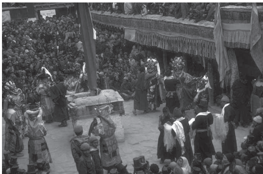
写真3 ラダックの僧院におけるチャム (1984年)

⑤ 一五世紀のタクブン・デ王の治世(一四〇〇―一四四〇年頃)には、ゲルツク派の僧侶ラワン・ロロより、カダム派の僧院であったといわれるスピトク・ゴンパが再建されたことになっている。ラワン・ロロによってゲルツク派の教義が積極的にラダックに導入され、僧院のなかには、宗派を変更し再建されたもの