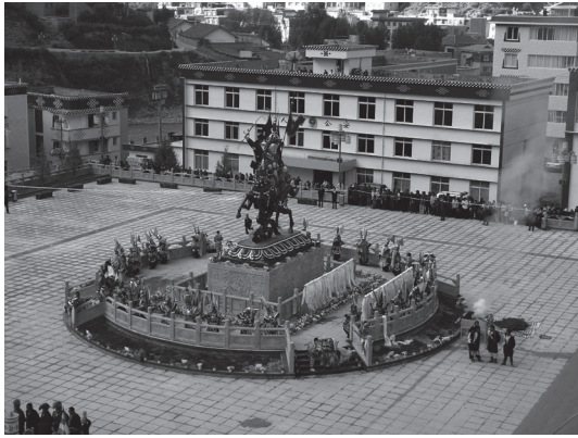
写真2 カム地方の町に建立されたケーサル像（2006年）

る町も出現していた（写真2。山田 2008: 7）。さらに、カム地方のチベット人の中では青海省、四川省、雲南省にまたがるカンパ（カムの人）全体の祭りの開催が行われるようになっていた。ここには、伝統文化復興のシンボルとなるものが、地域ごとに少しずつ異なるという傾向、いいかえれば、伝統の違いによって地域間の差異化を図ろうとする姿勢とともに、たとえばカンパとしての帰属意識のように、かつての領域区分に根ざした地域主義の活性化が図られるのを見ることができるといえる。